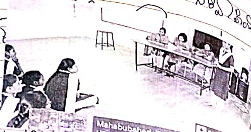
Mahabubabad, Telangana, India H2w6+724, Mahabubabad, Gumudur, Telangana GPS Map Camera